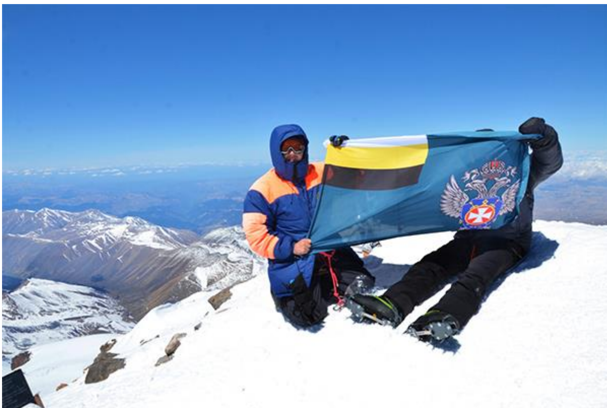
Восхождение на Западную вершину Эльбруса.

— Расскажите о самом крупном успехе казаков?