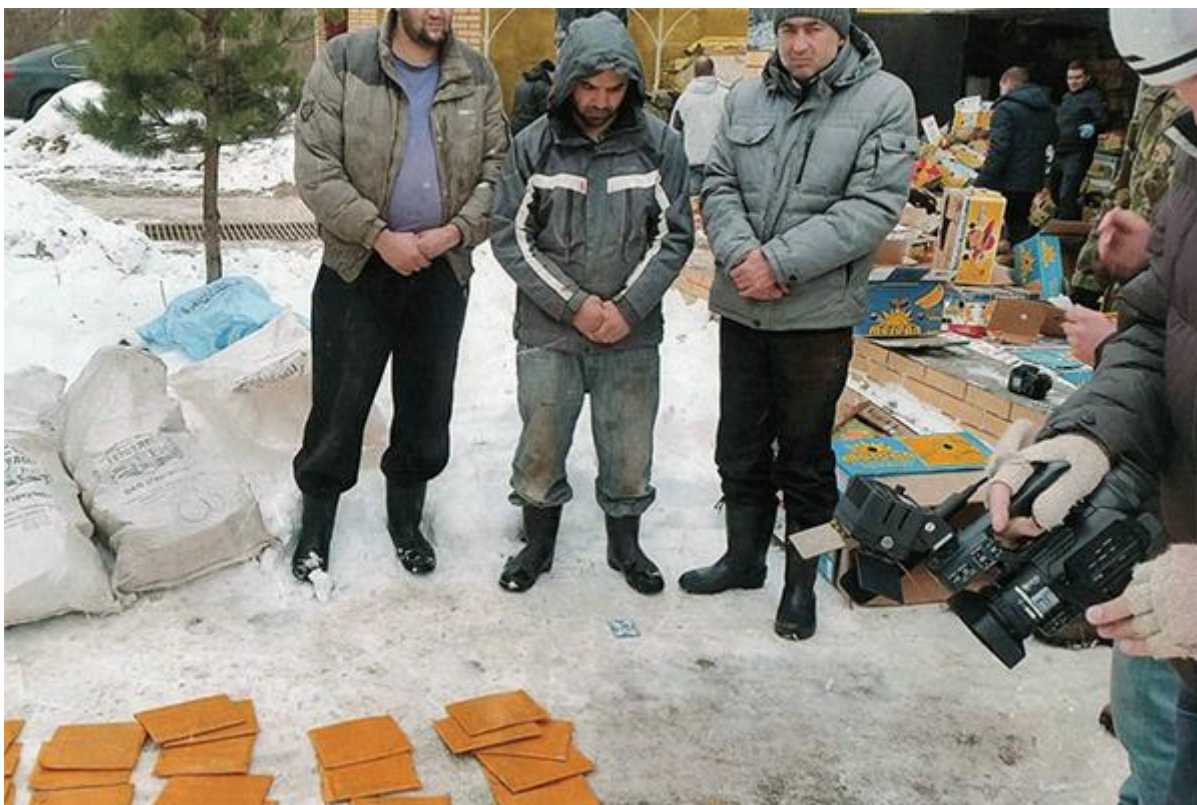
Наркоторговцы, задержанные силовиками и казачьим патрулем.

— «Русская Планета» неоднократно писала о необходимости укрепить южную границу нашей страны. Есть ли, на ваш взгляд, кардинальное решение проблемы проникновения наркотиков в Россию?